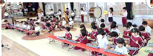
お遊戯会の様子は次号で紹介します。