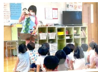
「保育科」向陽幼稚園で保育実習。