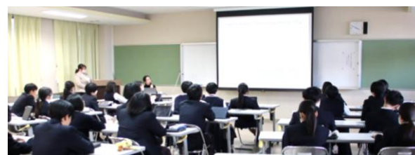
「海外大学進学」説明会。