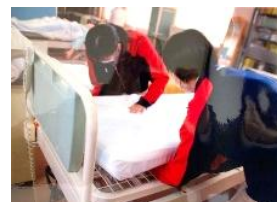
「福祉科」介護やベッドメイキング実習。