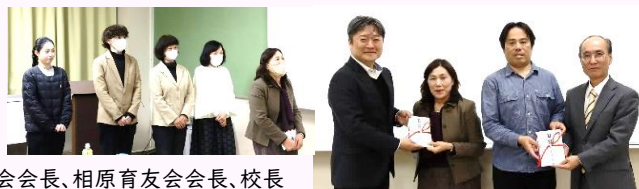
写真左から同窓会役員、理事長、高山同窓会会長、相原育友会会長、校長