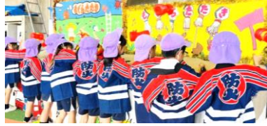
「ちびっこ防火大会」に参加しました!