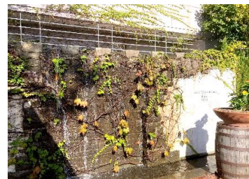
「流水復元」玄關正面の滝！

ステージ発表や校内で各種出し物のブースが開設され、また、「創立100周年記念行事」として企画された「モザイクアート」の展示や、「合唱コンクール」で予選を勝ち抜いた優秀クラスの発表等がありました。