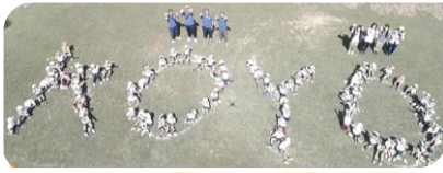
「ドローン」体験しました!