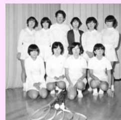
昭和53年度 卒業アルバムより (テニス部)