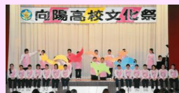
平成28年度 卒業アルバムより