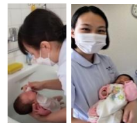
「母性看護学」の実習

専攻科2年生の領域実習が、コロナ禍での状況に応じて各領域施設と連携を図り、学内実習に変更するなどして現場経験が実践出来良い学びが出来ました。