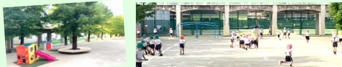
「園児を待つある朝の園庭」