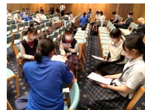
「インターアクトクラブ」年次大会参加 於：長崎ブリックホール