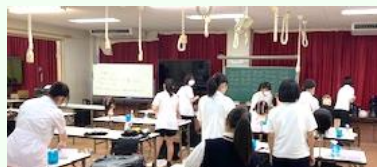
「早朝からワインディング練習」