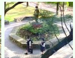
「朝の登校を見守る乙女の像」