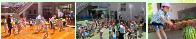
夏の思い出「楽しかった水遊び、スイカ割り」