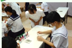
「オープンスクールで 優しく説明」