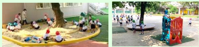
「おはよう 今日もなかよく元気!」