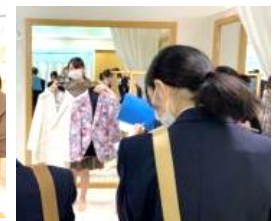
「エステティック科ブライダルコース」研修 於：ホテルオークラJRハウステンボス