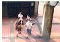
「今日も一日頑張ろう」