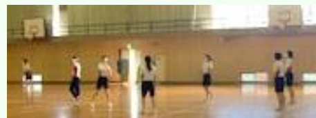
「今日という日は明日はない」「毎日一所懸命」