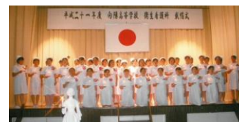
平成21年 衛生看護科戴帽式