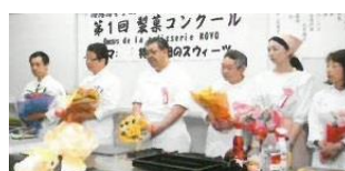
平成21年 「第1回製菓コンクール」 パティシエ科講師