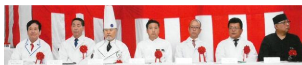
平成23年「第1回すしコンテスト」調理科講師