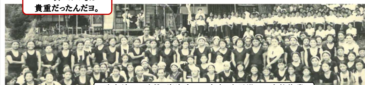
玖島崎での水泳・寄宿舎での食事・忠霊塔での奉仕作業