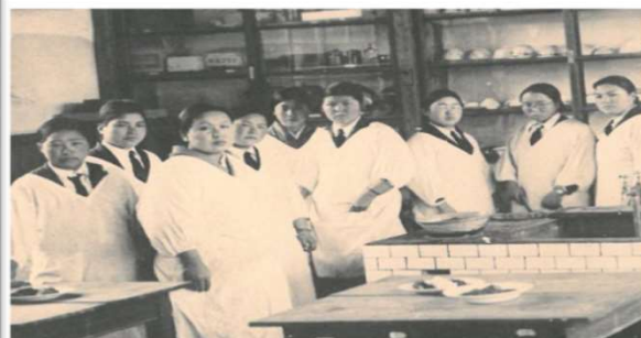
教員養成科授業:家庭科教員資格試験免除